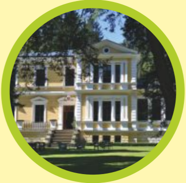
Vysoká u Příbramě zámek