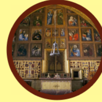
Karlštejn kaple sv. Kříže