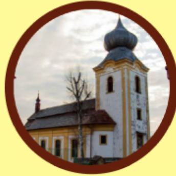
Ledce kostel sv. Jakuba