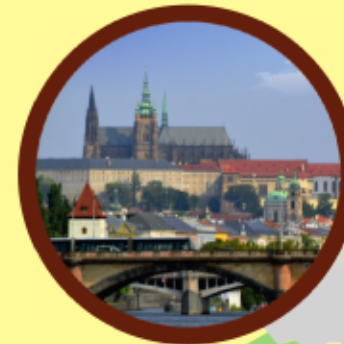
Praha Pražský hrad