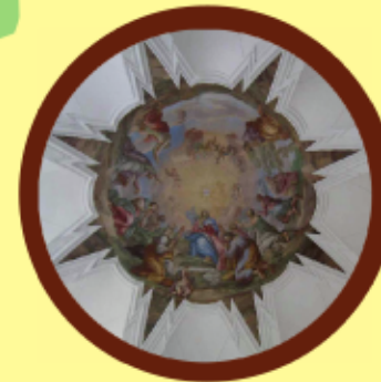
Klášter Plasy stropní výzdoba