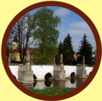
Bělá nad Radbuzou barokní most se sochami svatých