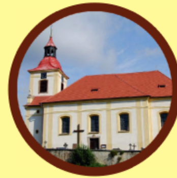
Žebnice - kostel sv. Jakuba

Železná svatojakubská trasa vychází z centra Prahy od kostela sv. Jakuba a jde souběžně se Všerubskou svatojakubskou cestou přes Zbraslav do Karlštejna, kde se obě cesty rozcházejí. Trasa vede po turistických cestách vyjma úseku mezi Starým Městem a Zbraslaví v Praze. Značení najdete na tabulkách rozcestníků KČT. Délka Železné trasy je 258 km.