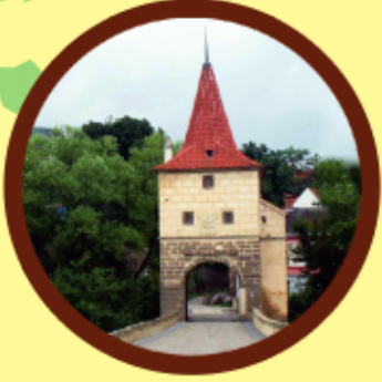
Stříbro kamenný most s mostní bránou