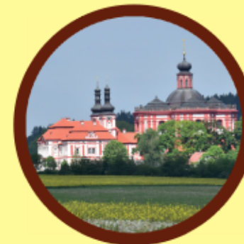
Mariánský Týnec klášter Mariánská Týnice