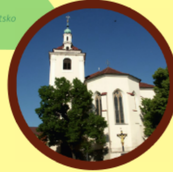
Beroun kostel sv. Jakuba