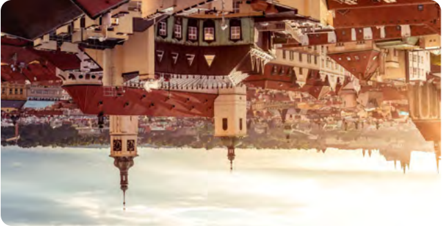
14 bazilika sv. Jakuba Staršího Basilika St. Jakob Praha

Barokní bazilika prosilá varhanami se čtyřmi manuály a sbírkou 22 oltářních obrazů Petra Brandla. Vyznamně svatojakušských tras. Die Barockbasilika ist berühmt für ihre Orgel mit vier Manualen und die Sammlung aus 22 Altarbildern von Peter Brandl. Ein bedeuten- der Ort der Prager Musik- und Kunsttradition, Kreuzungspunkt der Jakobswege.