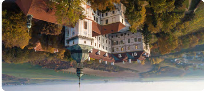
10 zámek Schloss Benátky nad Jizerou

Renesančně-barokní zámek, rozšířený v 17. a 18. století. Působil zde Tycho Brahe a také Bedřich Smetana. Dnes muzeum, městský úřad a soukromá sbírka hraček. Renaissance-Barock-Schloss, erweitert im 17. u. 18. Jh. Wirkungsort von Tycho Brahe und Bedřich Smetana. Heute Museum, Gemeindegemeindeamt und private Spielzeugsammlung.