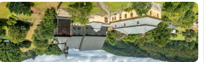
3 kostel sv. Kryštofa K. des Hl. Christophorus Kryštof. Udolí