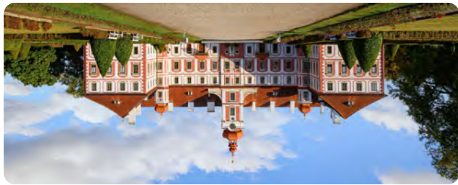
7 kostel sv. Jakuba Jakobskirche Mníchovo Hradiště 8 zámek, kapucínský klášter Schloss, Kapuzinerkloster

Děkanský kostel z let 1726-1727 s rokokovým, barokním vybavením. Vrcholně barokní zámek s kaplí sv. Anny s hrobkou Albrechta z Valdštejna. Klášter z přelomu 17. a 18. století. Dekanatskirche von 1726-1727 mit Roko- und Barockausstattung. Hochbarockschloss Wallenstein. Kloster von der Wende des 17. und 18. Jh. mit Kapelle Hl. Anna und Grabstätte des Albrecht von