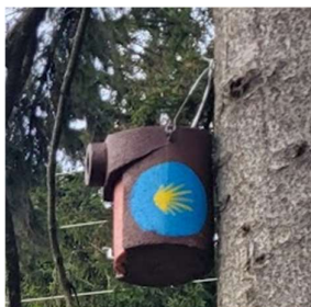
Levá vpřed (LvP)